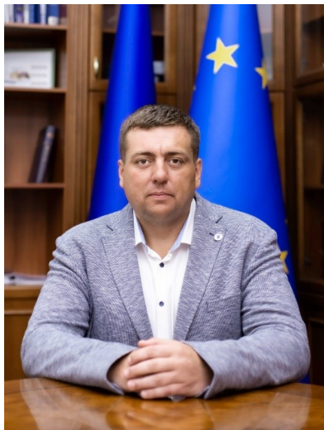
ВЕРВЕЙКО Іван - керівник Секретаріату Уповноваженого Верховної ради України з прав людини